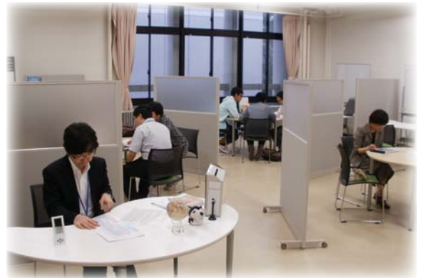
進路相談会(9月26日)の風景 個別ブースを設置し、質問・相談に応じました。

来年2月に、2回目の学部・学科等移行ガイダンスが行われます。ASCは今回と同様、進路相談会を開催する予定です。