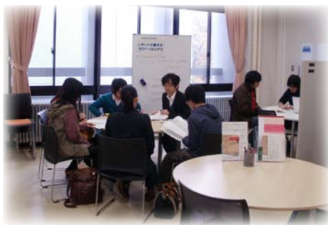
スタディ・スキルセミナーの様子

スキルアップセミナーの発表資料はHUSCAPのホームページ( http://hdl.handle.net/2115/50418 )で閲覧することができます。