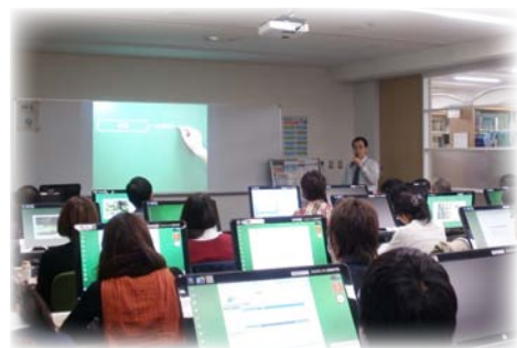
スキルアップセミナーの様子